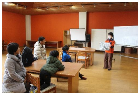
どんな痕跡があるかな？