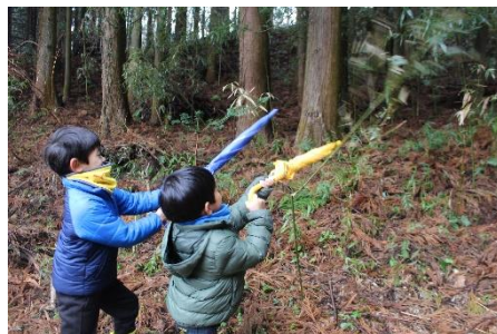
竹をビシバシ！楽しいね♪