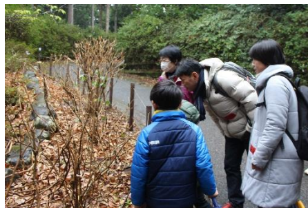
アジサイの顔さがし(^-^)