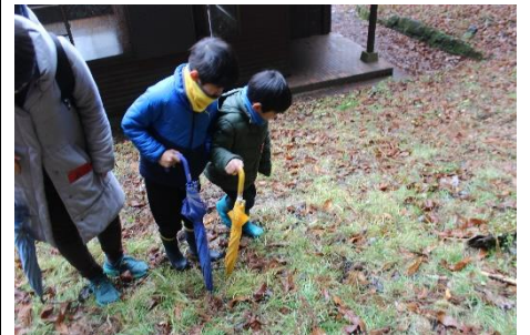
なにかのフン発見！