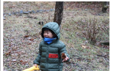
クリ発見！ちょっと痛いね☹️