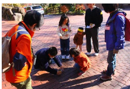
さっそくカマキリを発見！