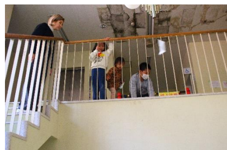
こんな風に飛ぶんだね♪