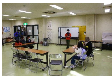
どんな出会いがあるかな？