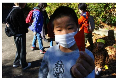
折り紙で種の模型を作ったよ