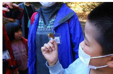
ナナフシ見つけた！