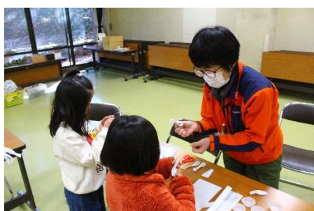
色々な種の模型を作ろう