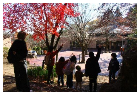
モミジの種を飛ばしてみよう！