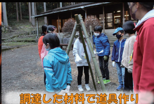
調達した材料で道具作り