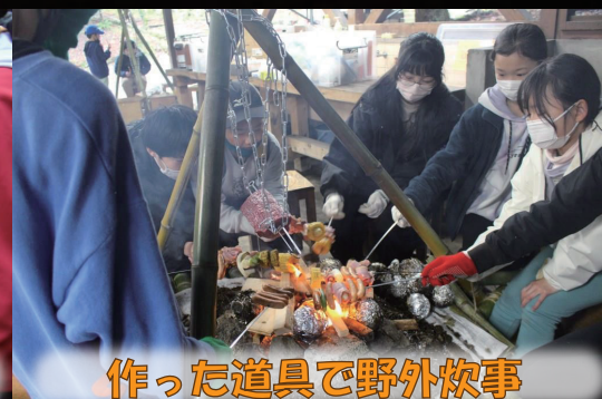
作った道具で野外炊事