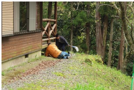
アリジゴク探し中！