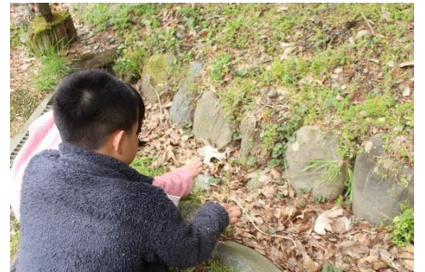
面白い！種が弾けたよ！