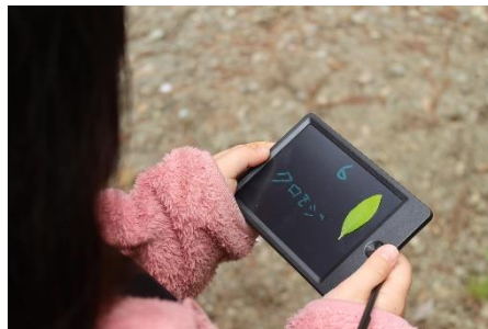
忘れないように書いたよ(*^^*)