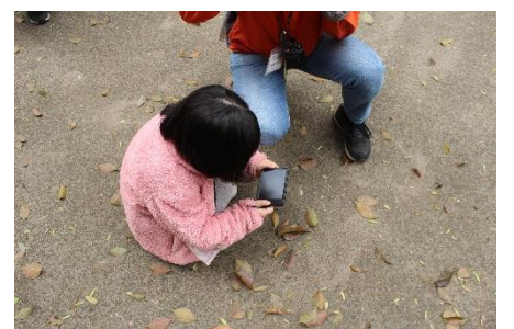
同じ匂いは「楠木の葉」でした