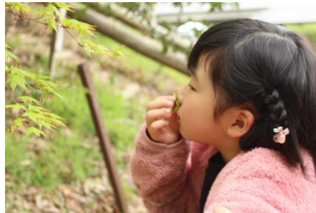
ん〜…この匂いはなんだろう