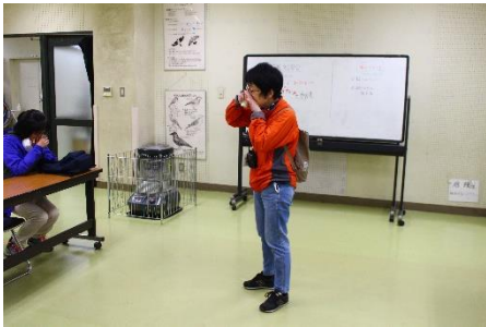
同じ匂いの物を探しに出発