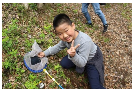
アマガエル見つけた！