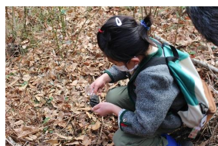
フンもたくさんありました 🐾