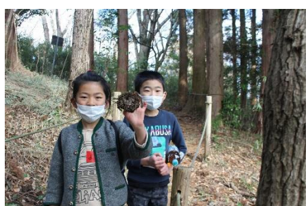
ハチの巣もありました