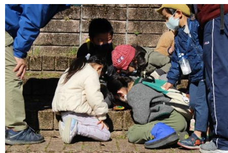
足元をじっくり観察(´_`)