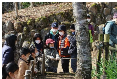
チューリップはまだかな？