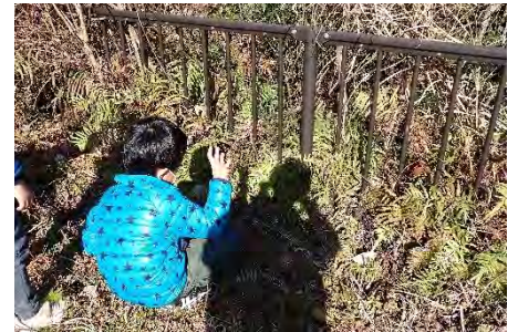
ちょうちょもいました♪