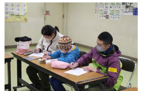
今年もよろしくお願いします！