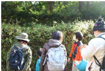
なになかな？なになかな？