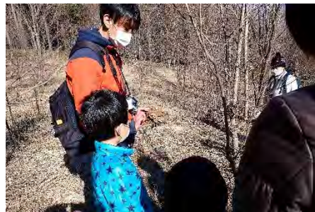
鳥の巣がありました♪