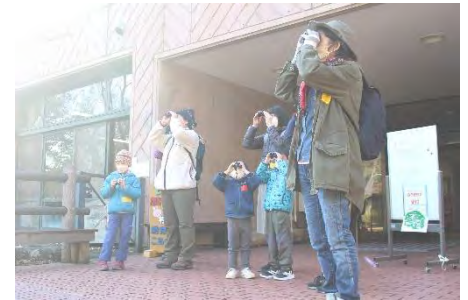
双眼鏡を使います！